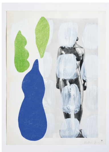
Corps et paysage (2024) peinture, pastel, collage / verf, pastel, collage / paint, pastel, collage 29 x 39 cm