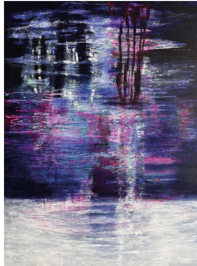
251013 (2025) acrylique sur Dibond / acryl op Dibond / acrylic on Dibond 120 x 90 cm