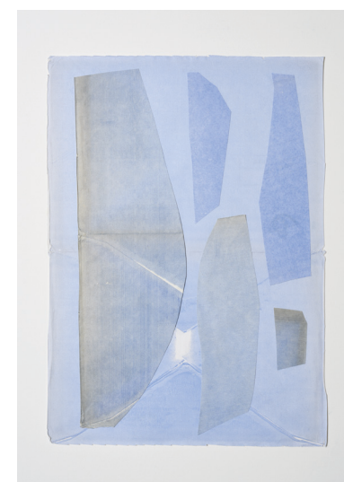
Lettres du paysage IV (2026) collage 32,5 x 23 cm