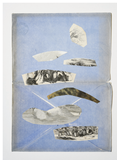
Lettres du paysage X (2026) collage 32,5 x 23 cm